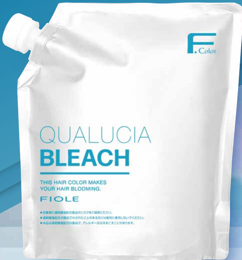
クオルシア ブリーチ 〈脱色剤〉 500g 業務用 医薬部外品